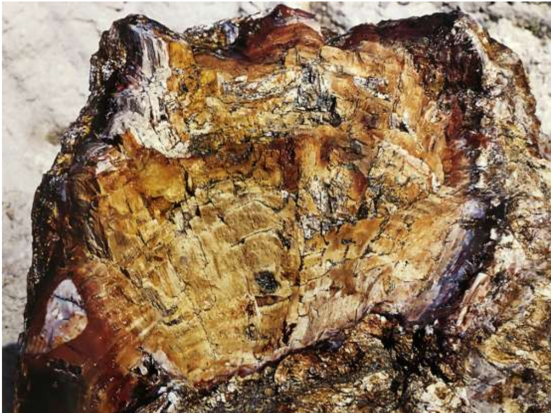
Απολιθωμένος κορμός πλατάνου από το Απολιθωμένο Δάσος της Λέσβου

Ο Πλάτανος χάρη στην μεγαλοπρέπεια του χρησιμοποιείται ευρύτατα για καλλωπιστικούς σκοπούς, είτε για τη δημιουργία δεντροστοιχιών, είτε για να κάνει διακριτές τις πλατείες των κωμοπόλεων και των χωριών.