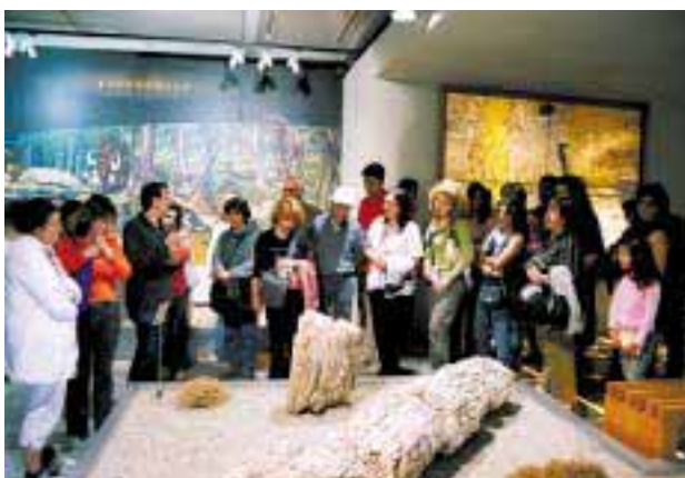
Από την επίσκεψη των εκπαιδευτικών στο Μουσείο